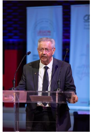
Une ouverture dynamique