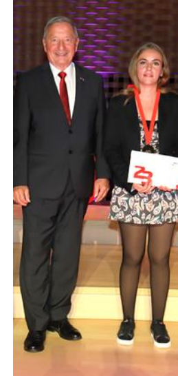
Le Vaucluse à l'honneur