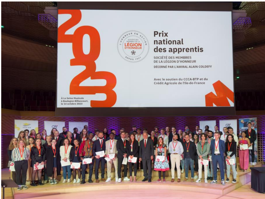
La jeunesse :70 apprentis